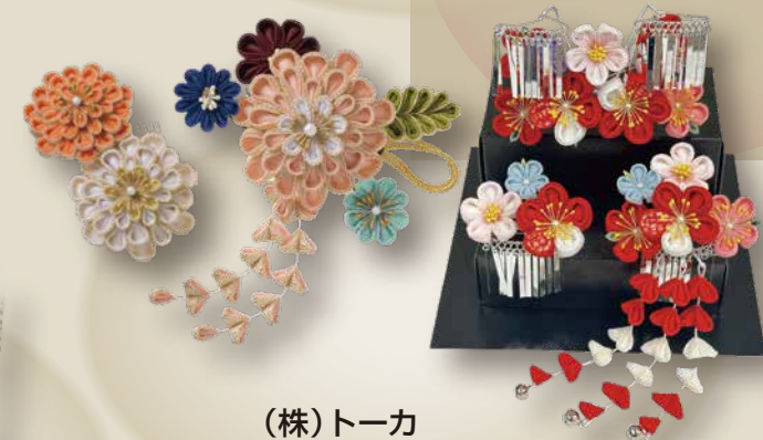
(株)トーカ 東京都台東区柳橋2-16-6 tel.03-3862-7501