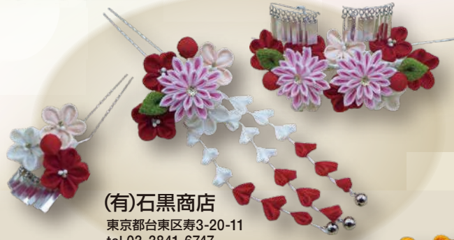
(有)石黒商店 東京都台東区寿3-20-11 tel.03-3841-6747