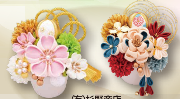
(有)杉野商店 東京都墨田区向島3-20-7 tel.03-3624-6846