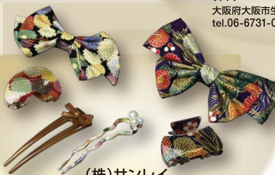
(株)サンレイ 東京都江東区森下2-6-1-101 tel.03-3633-8831