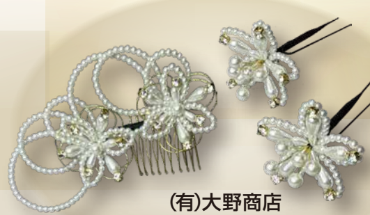
(有)大野商店 東京都台東区鳥越2-7-12 tel.03-3851-9929