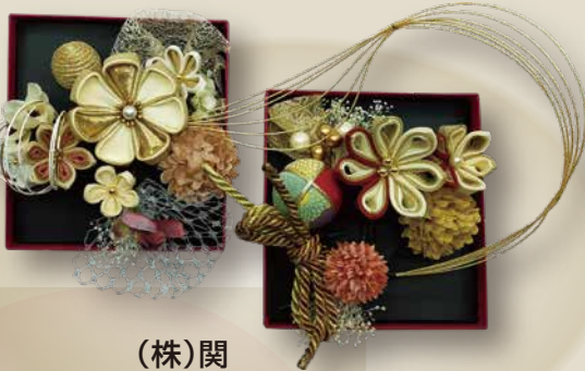
(株)関 東京都台東区東上野6-11-4 tel.03-5830-3911