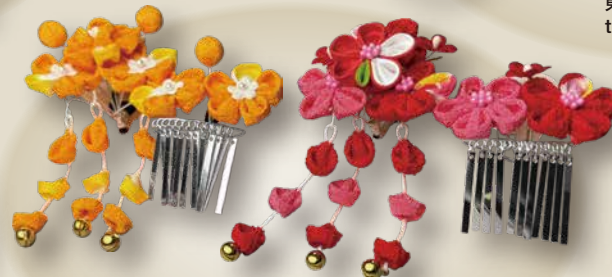
(株)セリーナ 東京都墨田区向島3-5-10 tel.03-3622-8488