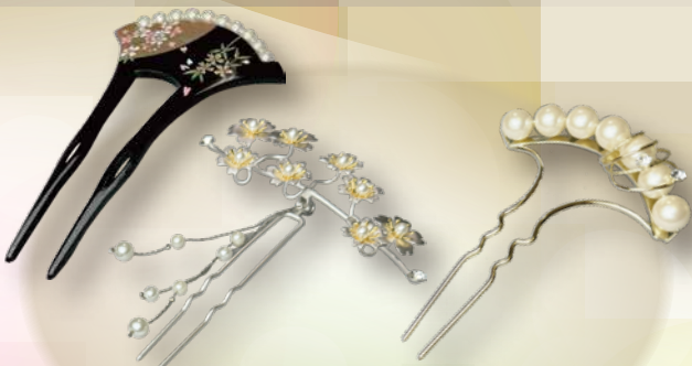
(株)藤崎 東京都江東区亀戸4-46-12-5F tel.03-6807-0341