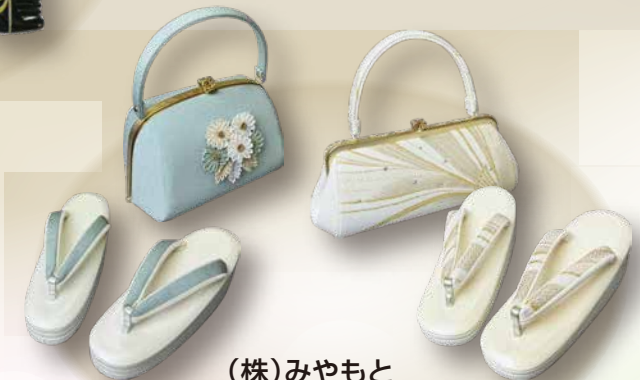
(株)みやもと 東京都台東区浅草3-22-4 tel.03-3874-1059