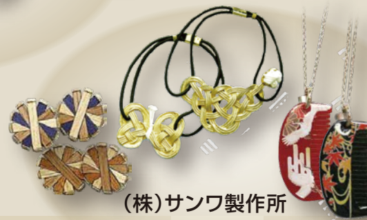
(株)サンワ製作所 大阪府大阪市生野区生野西1-12-8 tel.06-6731-0112