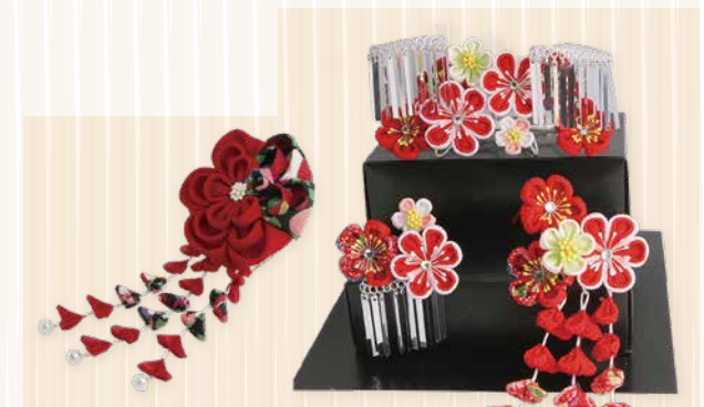
(株)トーカ 東京都台東区柳橋2-16-6 tel.03-3862-7501