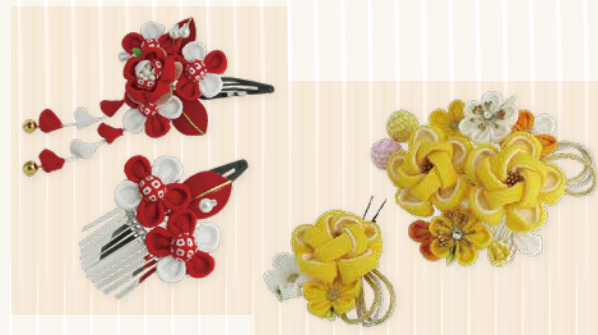
(株)セリーナ 東京都墨田区向島3-5-10 tel.03-3622-8488