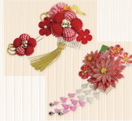
(有)杉野商店 東京都墨田区向島3-20-7 tel.03-3624-6846