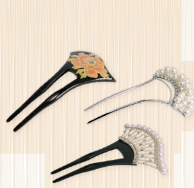
(株)佐野 東京都台東区竜泉1-22-10 tel.03-5603-2504