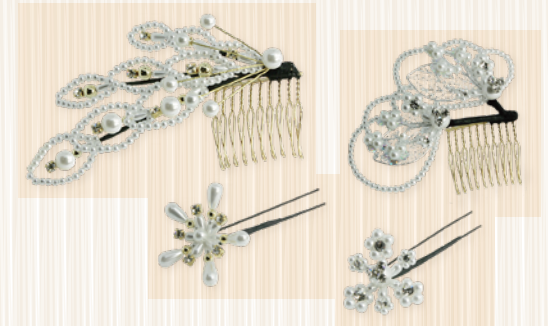
(有)大野商店 東京都台東区鳥越2-7-12 tel.03-3851-9929