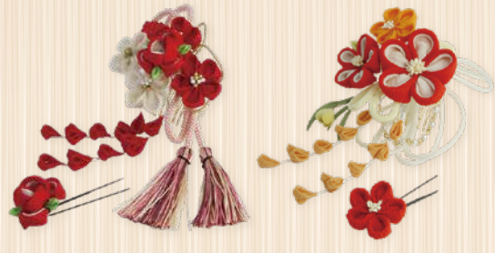
(有)石黒商店 東京都台東区寿3-20-11 tel.03-3841-6747