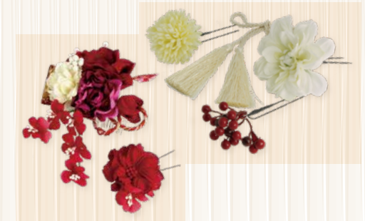
(株)関 東京都台東区三筋1-14-10 tel.03-3866-3310