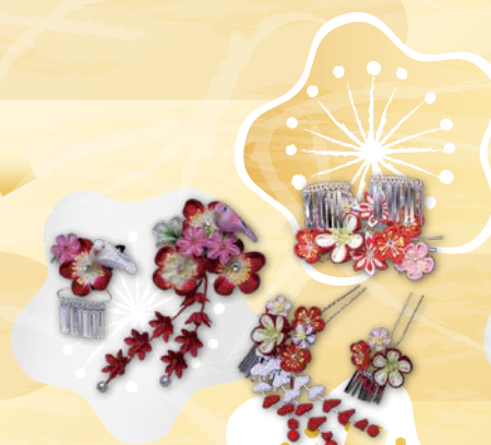
(株)トリーカ 東京都台東区柳橋2-16-6 tel.03-3862-7501