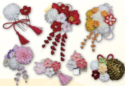
(有)石黒商店 東京都台東区寿3-20-11 tel.03-3841-6747