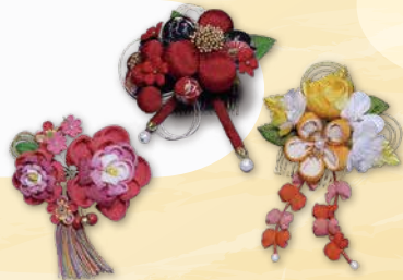
(有)杉野商店 東京都墨田区向島3-20-7 tel.03-3624-6846