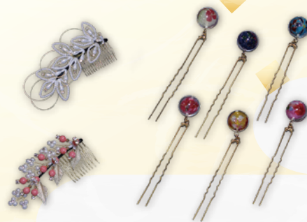
(有)大野商店 東京都台東区鳥越2-7-12 tel.03-3851-9929