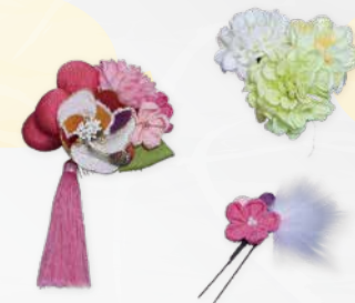
(株)オザワ 東京都台東区三筋1-14-10 tel.03-3866-3310