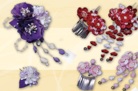
(株)セリーナ 東京都墨田区向島3-5-10 tel.03-3622-8488