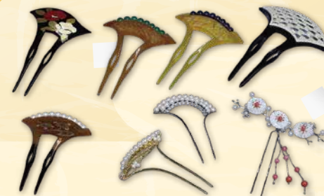
(株)佐野 東京都台東区亀泉1-22-10 tel.03-5603-2504