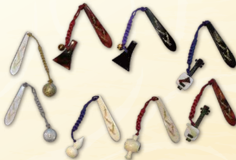
(株)コヤマ 東京都文京区本駒込3-17-11 tel.03-5815-4666